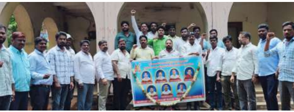
మాదిగ అమరుల కుటుంబాలను ప్రభుత్వం ఆదుకోవాలి