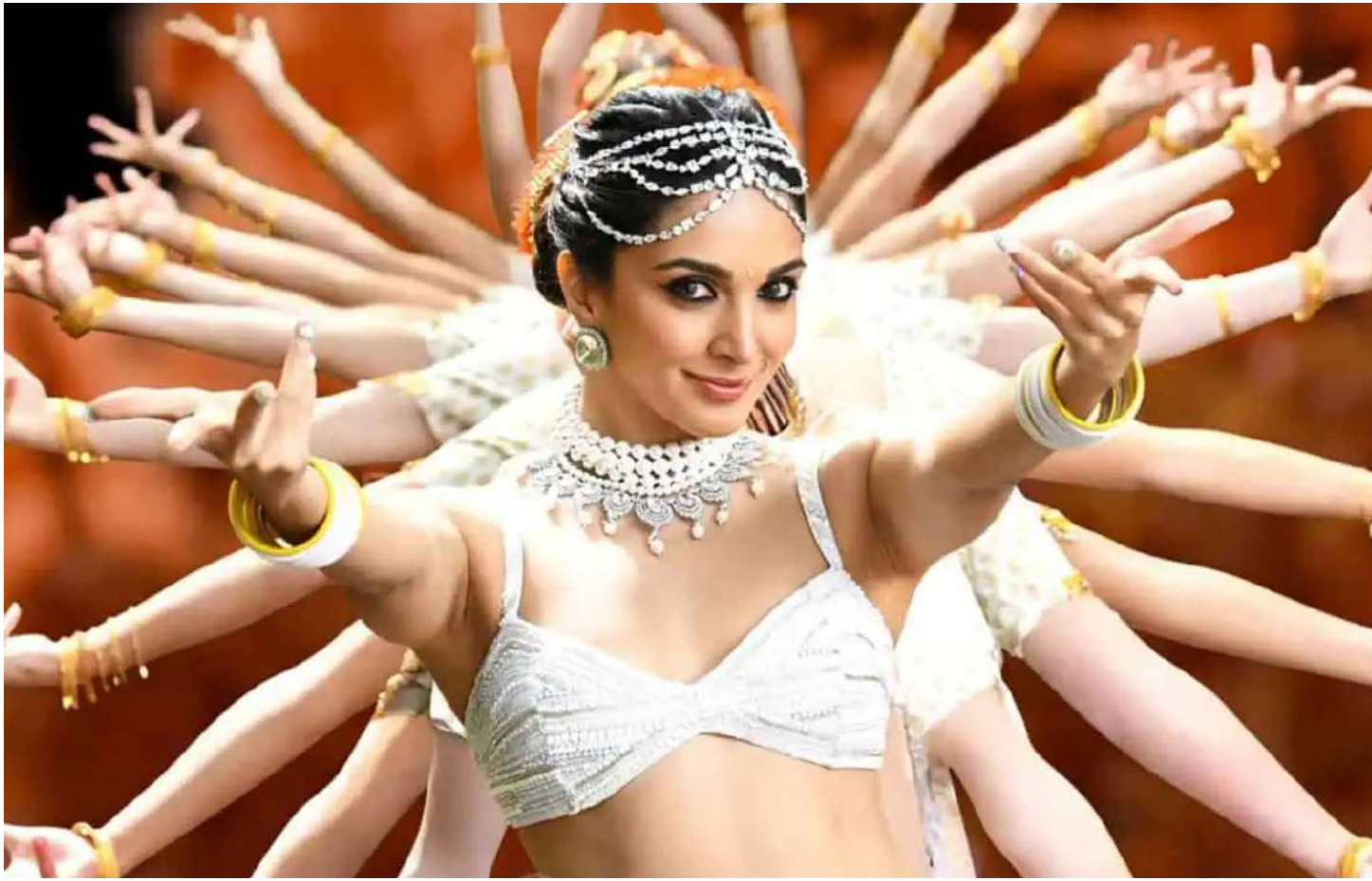
మరింత రెచ్చింపు చేసేలా

TELANGANA VANI TELUGU DAILY తెలంగాణ వాణి తెలుగు దినపత్రిక The Voice of Telangana