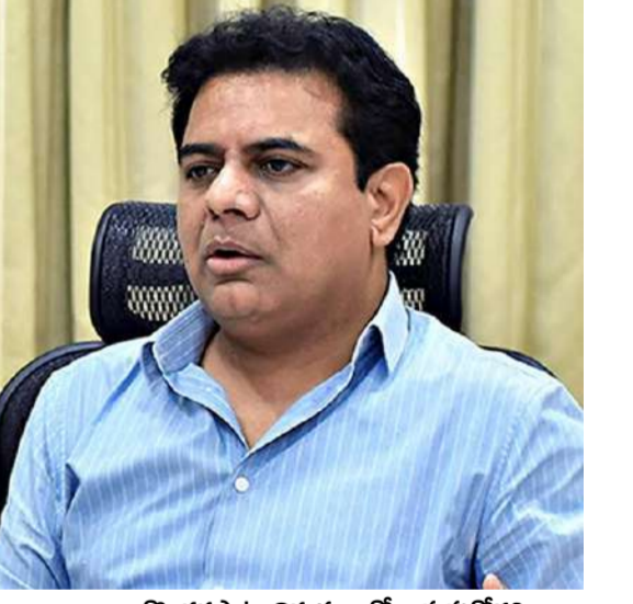
తొందరపాటు నిర్ణయాలతో రాష్ట్ర పురోగతి దెబ్బతింటుంది

సగరంలో తలపెట్టిన ఫార్యాసిటీ ప్రాజెక్టును కాంగ్రెస్ ప్రభుత్వం కొనసాగిస్తుందా..? లేదా..? అనే అంశంపై స్పష్టత ఇవ్వాలని సిఎం రేవంత్ రెడ్డిని బిఆర్ఎస్ వర్కింగ్ ప్రెసిడెంట్ కెటిఆర్ కోరారు. వెంటనే ప్రభుత్వం ఈ అంశంపై విధానపరమైన నిర్ణయాన్ని వెల్లడించాలని డిమాండ్ చేశారు. ఈ మేరకు సిఎం రేవంత్ రెడ్డికి కెటిఆర్ లేఖ రాశారు. లైఫ్ సైన్స్, ఫార్యా రంగాల్లో హైదరాబాద్ ను అంతర్జాతీయంగా నంబర్ వన్ గా నిలిపే ఉద్దేశంతో ఫార్యా సిటీ అనే బృహత్తరమైన ప్రాజెక్టును కెసిఆర్ ప్రభుత్వం చేపట్టిందని ఈ సందర్భంగా కెటిఆర్ గుర్తు చేశారు. ఇప్పటికే తెలంగాణ రాష్ట్రం ఫార్యాస్యూటికల్స్ ఉత్పత్తిలో దేశంలోనే 40 శాతం వాటా కలిగి ఉందని, వెయ్యికి పైగా లైఫ్ సైన్స్ కంపెనీలకు రాష్ట్రం ఆద్యాగా ఉందని తెలిపారు. ఏటా 80 బిలియన్ల దాల్చ విలువ చేసే ఉత్పత్తులను తెలంగాణ నుంచి తయారు చేస్తున్న విషయం ముఖ్యమంత్రికి తెలిసి ఉంటుందని, ఇలాంటి కీలకమైన రంగాన్ని మరింత ప్రోత్సహిస్తే రాష్ట్రానికి ఆదాయం పెరగటంతో పాటు మన యువతకు భారీగా ఉపాధి అవకాశాలు కల్పించవచ్చన్నారు. హతాత్తుగా ఈ ప్రాజెక్టును రద్దు చేస్తున్నట్లుగా సిఎం ప్రకటించటంతో ఫార్యా సిటీలో పెట్టుబడులు పెట్టే సంస్థలు ఆందోళన చెందాయని పేర్కొన్నారు. అదే విధంగా ఫార్యా సిటీ వస్తే ఉద్యోగాలు వస్తాయని భావించిన యువత, బతుకులు బాగుపడుతాయని భూములు ఇచ్చిన రైతుల్లో కూడా ఇప్పుడు గందరగోళం నెలకొని ఉందని, ఈ ప్రాజెక్టును ప్రభుత్వం కొనసాగిస్తుందా..? లేదా..? అన్న అంశంపై చాలా ఊహాగానాలు కొనసాగుతున్నాయన్నారు. అసలు ప్రాజెక్టు రద్దు చేస్తున్నట్లు ప్రకటించే ముందు భూములు ఇచ్చిన రైతులతో గానీ పెట్టుబడులు పెట్టడానికి ముందుకు వచ్చిన సంస్థలతో గానీ ఎందుకు సంప్రదింపులు జరపలేదో చెప్పాలని అడిగారు.